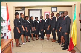
Notre équipe du Bénin

Burkina Faso Sénégal Côte d'Ivoire Cameroun