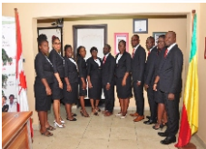
Votre Équipe ACCÈS CANADA au Bénin

Au Bénin, plusieurs firmes d'immigration sont apparues récemment. Certains sont des intermédiaires, d'autres firmes n'opèrent pas au Bénin, d'autres se lancent dans le domaine en faisant plusieurs choses en même temps et ne se sont donc pas spécialisées. C'est le cas notamment de plusieurs avocats. D'autres opèrent sans être accréditées, ce qui est aujourd'hui totalement illégal. Ces personnes ne peuvent pas représenter des clients auprès des autorités canadiennes ou québécoises.